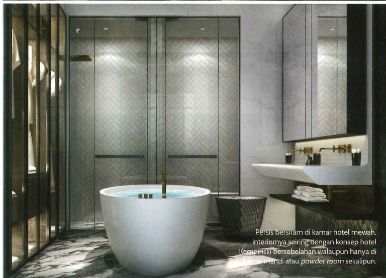
Persis bersiram di kamar hotel mewah, interiornya seiring dengan konsep hotel Kempinski bersebelahan walaupun hanya di kawasan mandi atau powder room sekalipun.