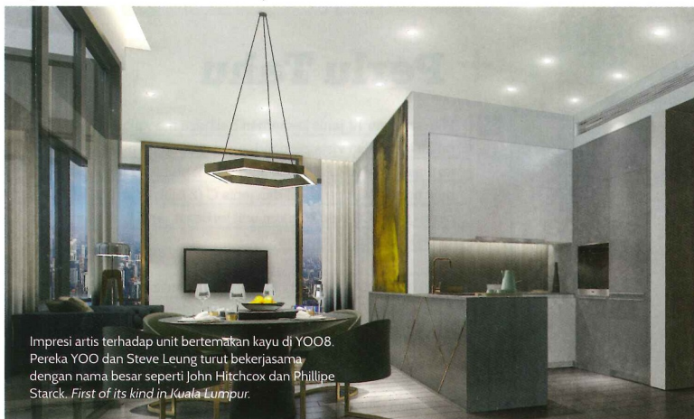
Impresi artis terhadap unit bertemakan kayu di YOO8. Peraka YOO dan Steve Leung turut bekerjasama dengan nama besar seperti John Hitchcox dan Philippe Starck. First of its kind in Kuala Lumpur.